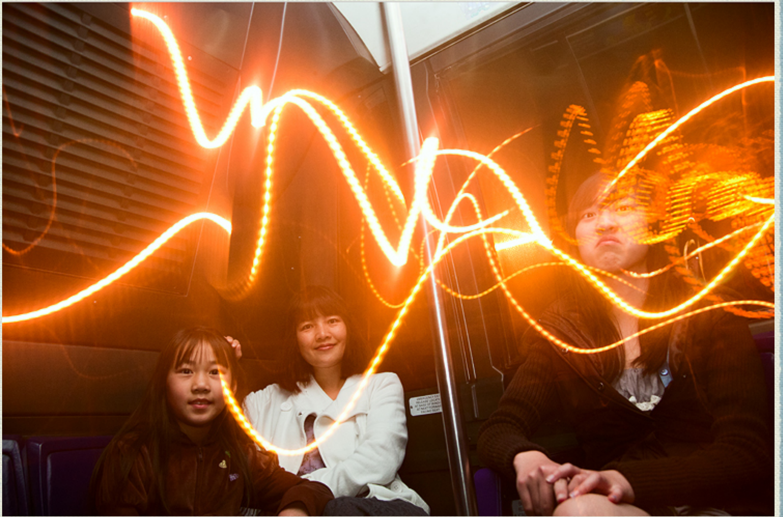
这张也算光绘，光是公车外的路灯光。曝完路灯，再对准家人，用闪光灯定格人像。