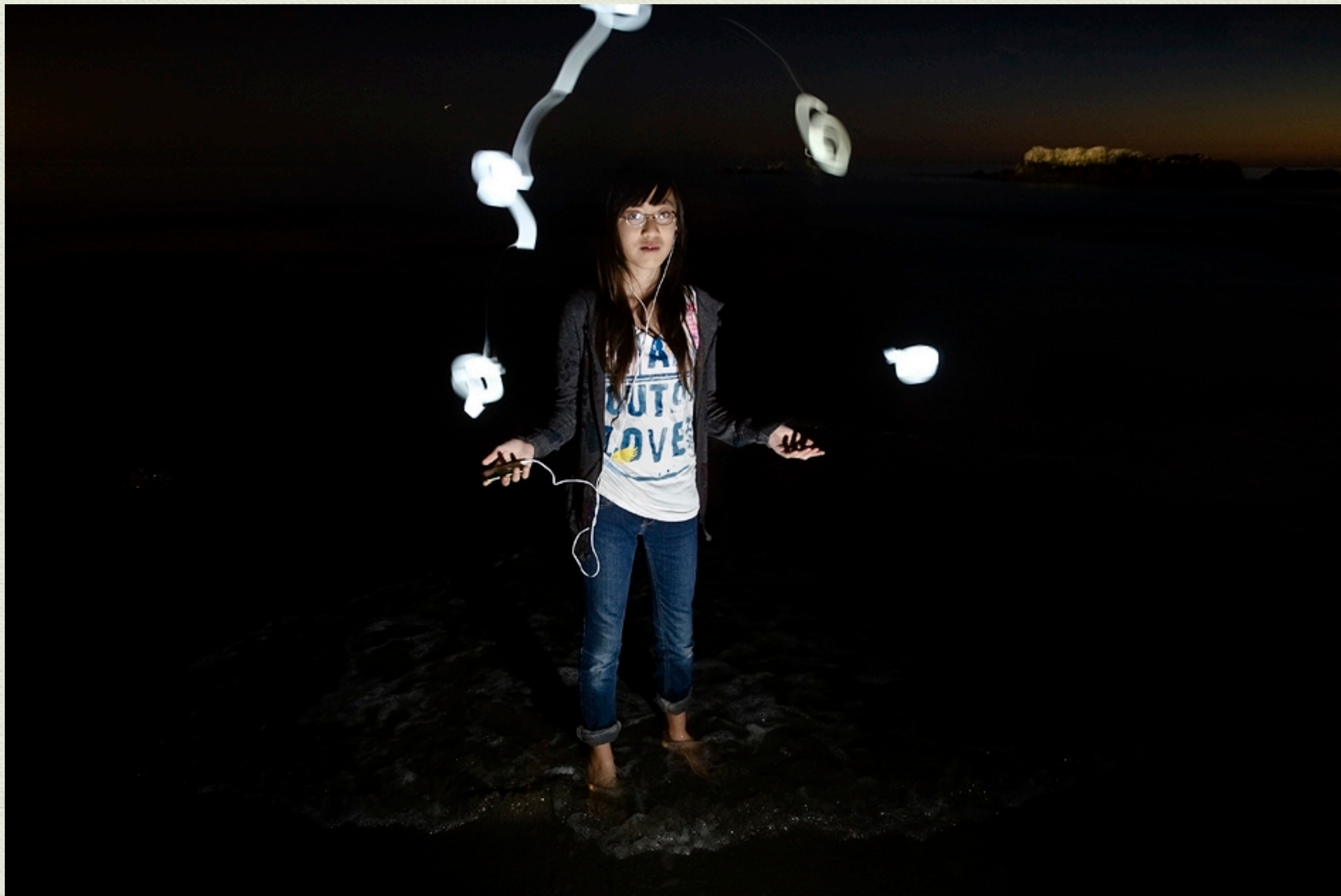
这是从国内回来后，在海滩上拍的。光源是大女儿的iPod.