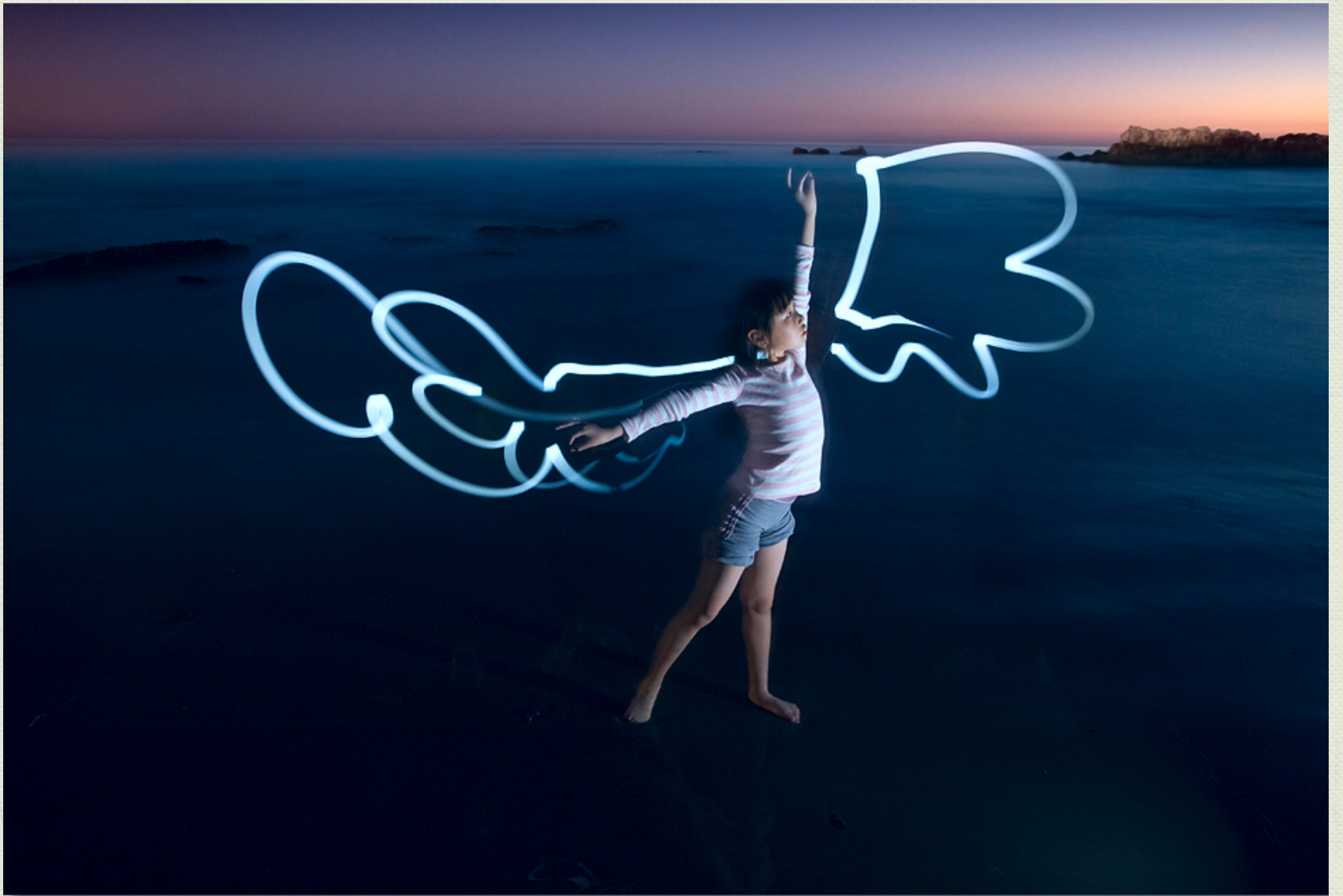
这是同一天晚上拍的。小女儿摆的是从舞蹈学校学的孔雀舞的姿势。大女儿画的翅膀。