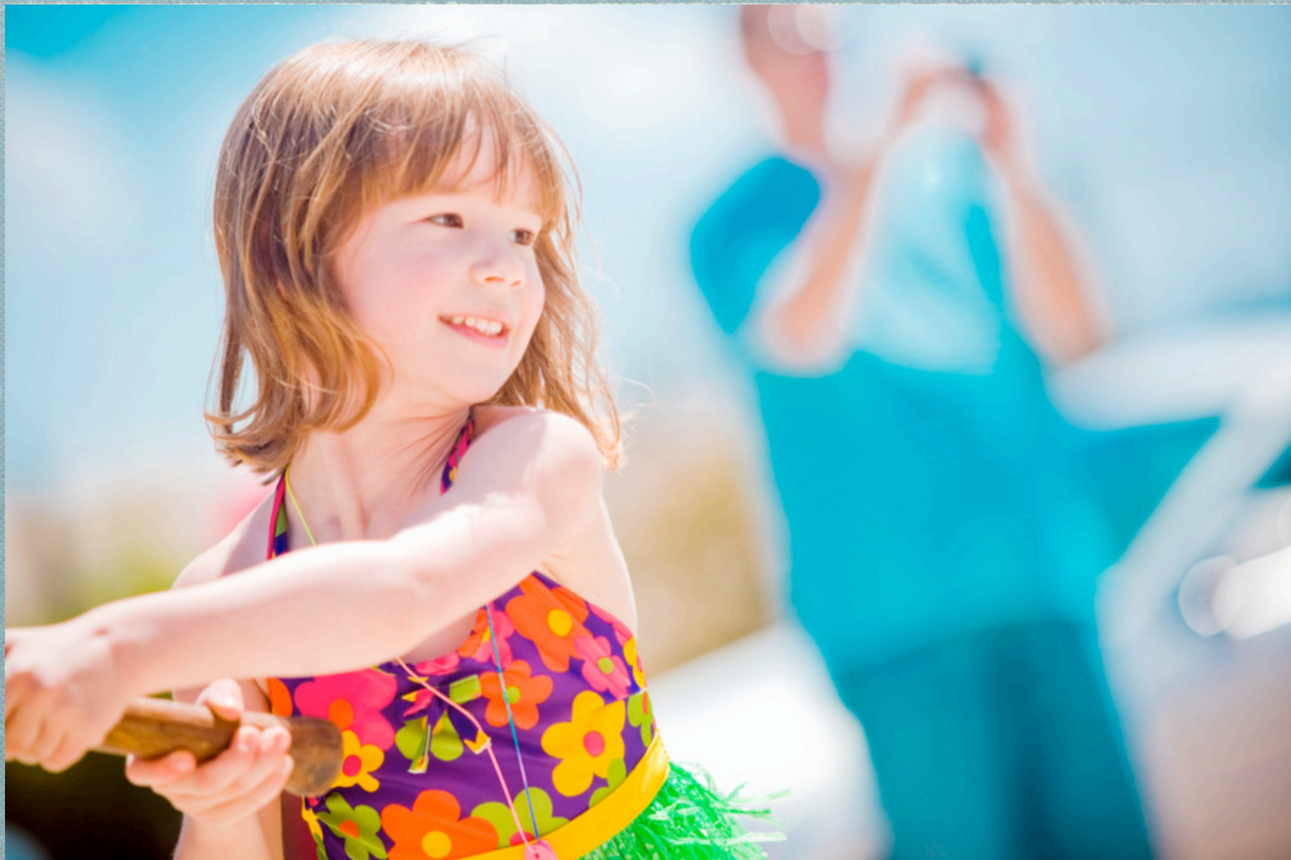
邻居小朋友的生日聚会