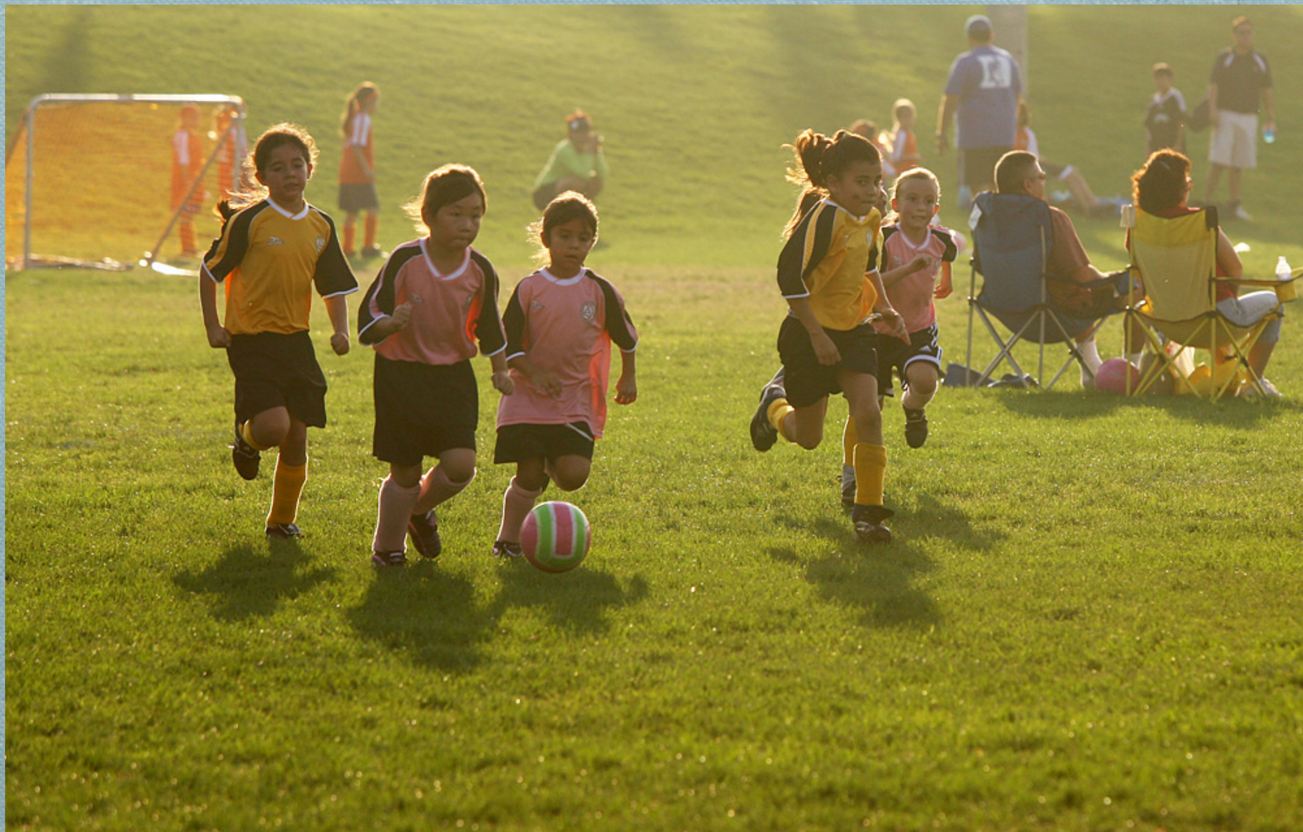
孩子活动照也要注意选择光线和背景