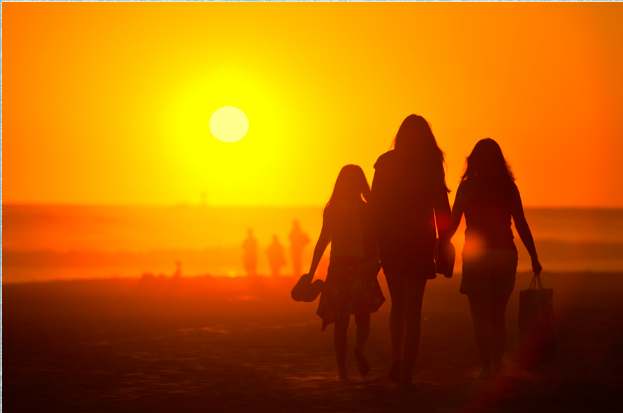
加州圣地亚哥海滩，家人在前面走，我在后面“偷拍”