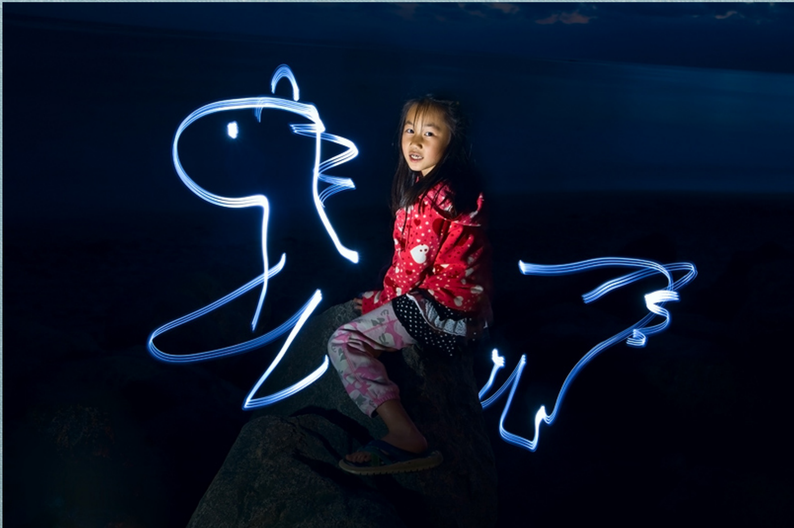
同一天晚上拍的。小女儿骑在岩石上。大女儿画的小马。