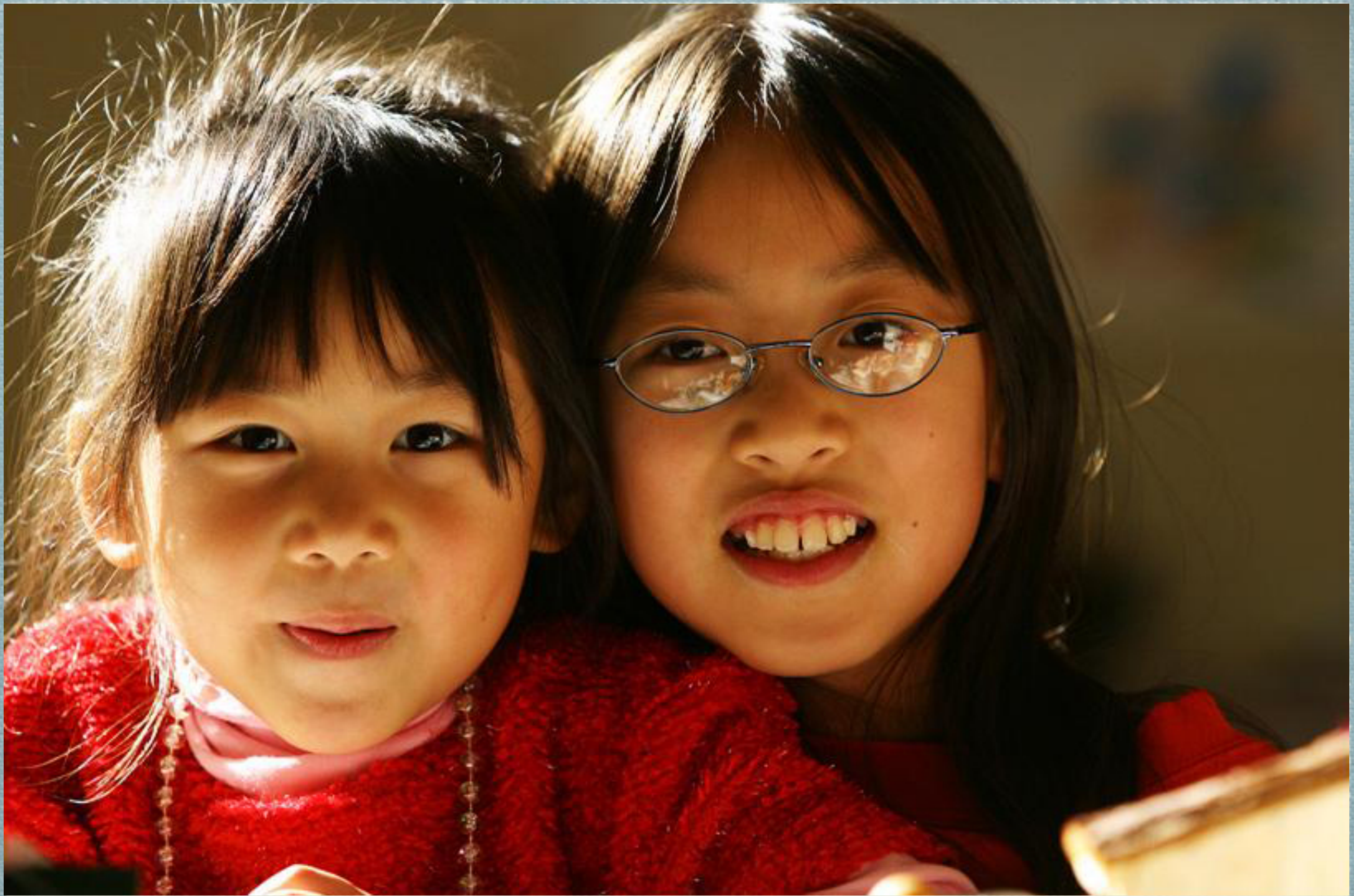
在家里为做圣诞贺卡拍的照片。