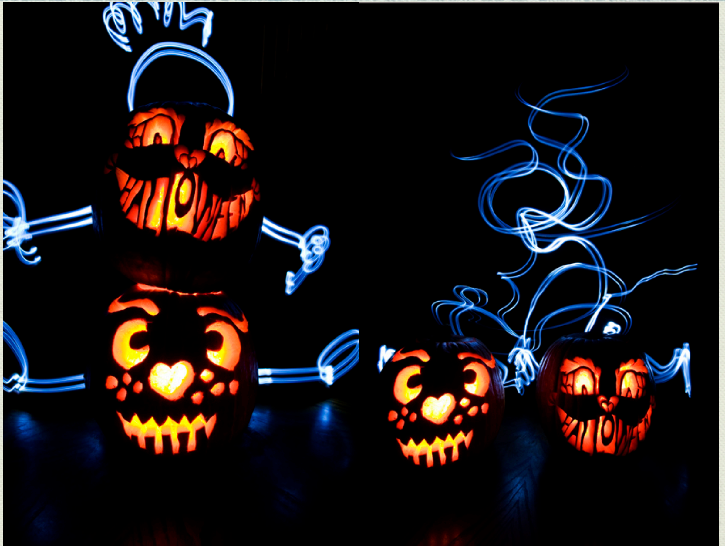
这张是光绘。万圣节孩子们做的南瓜灯。然后她们自己用手电画的光轨。