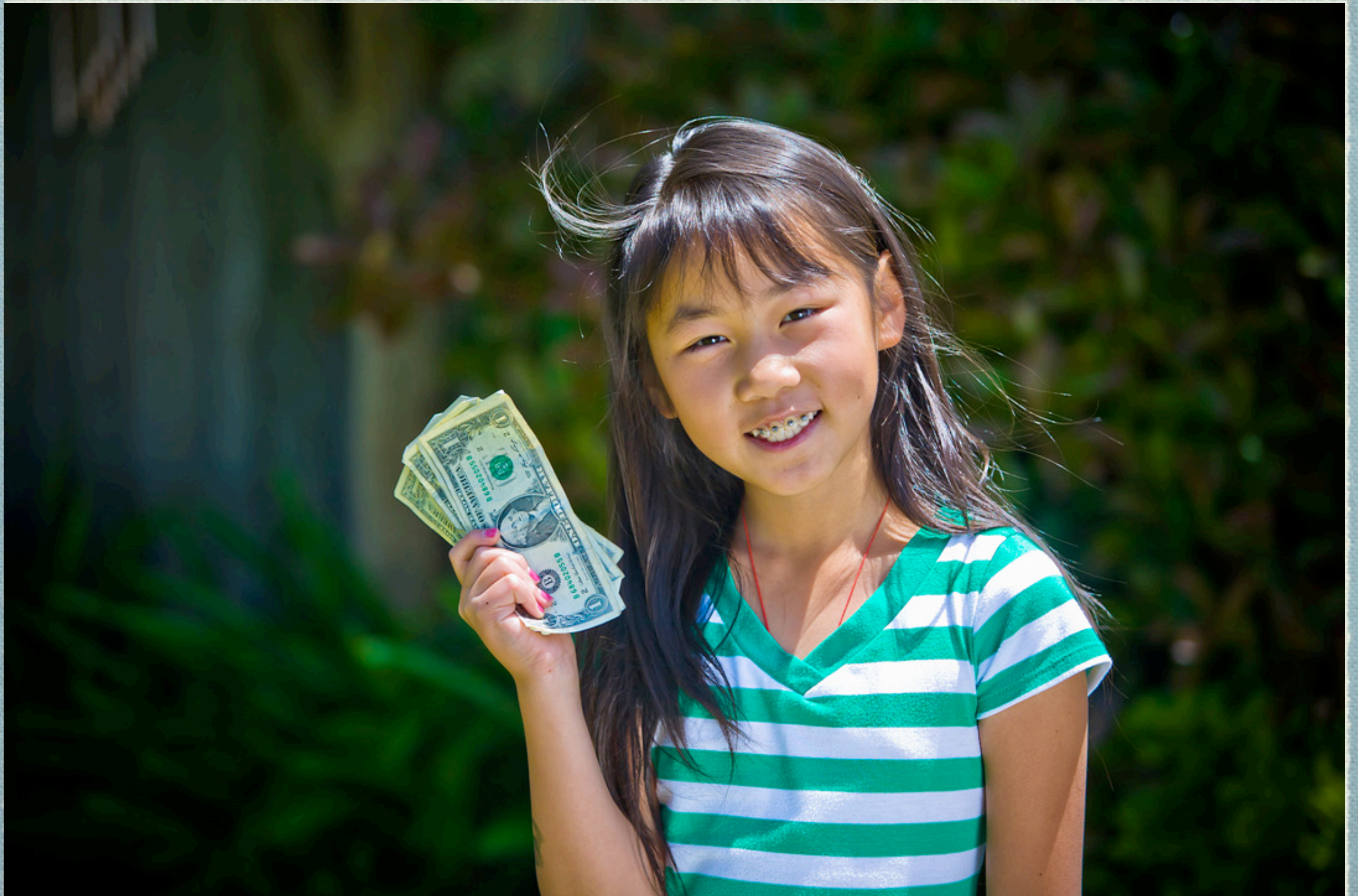
小女儿为自己在学生会竞选学生会会计而拍的广告。。