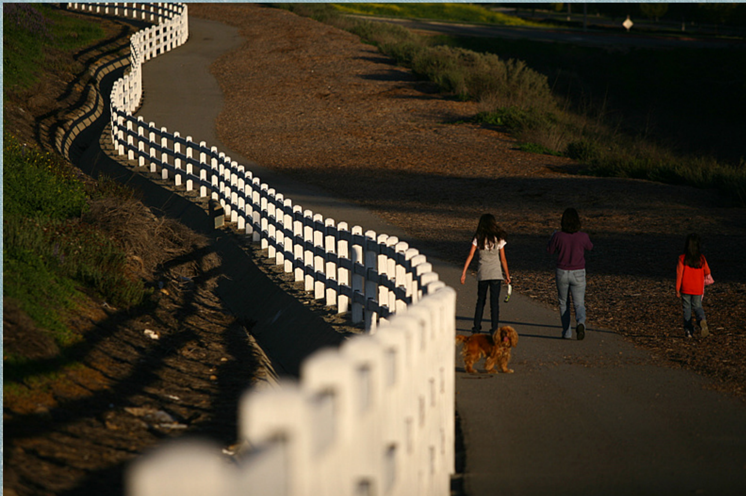
全家人在家门口散步。。