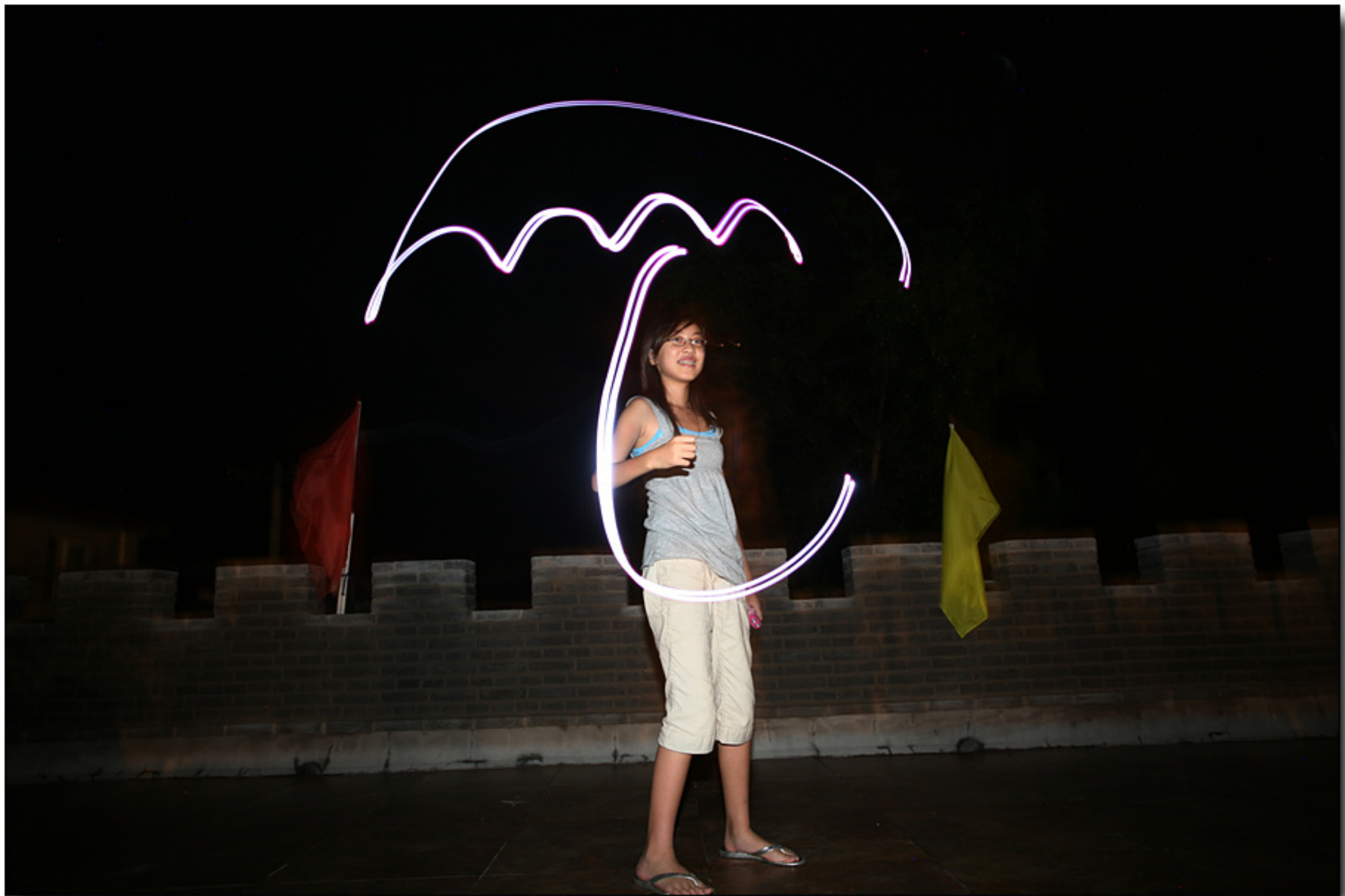
这里是那天晚上孩子们的几张作品。